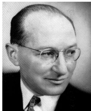
Kurt Lewin (1890 - 1947)