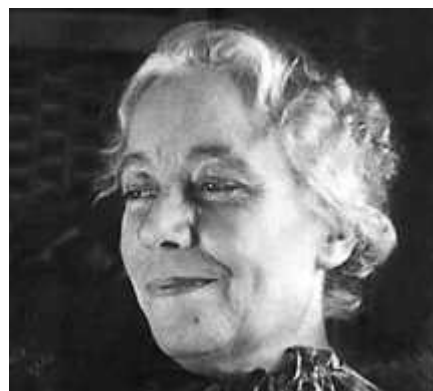
Karen Horney (1885 - 1952)