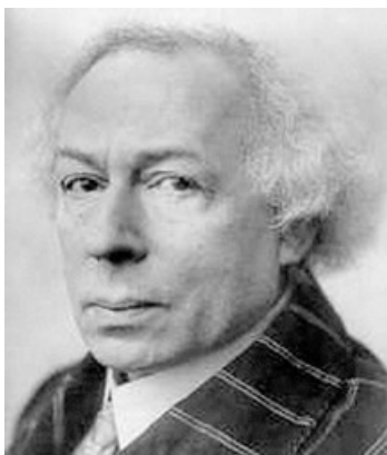
Salomo Friedländer (alias Mynona, 1871 - 1946)