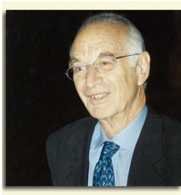
James Hillman (1926)