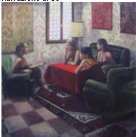
Biblioteca di Gornate Olona Venerdì 11 aprile 2008

due serate per riflettere sul valore della narrazione di Sé