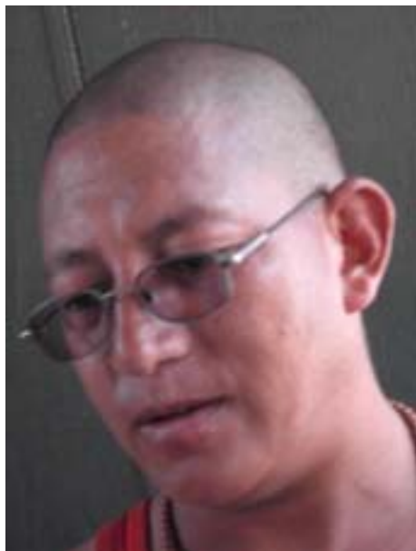
chi mi prestava la coperta che non avevo ...