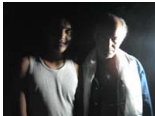
Khama e il saluto