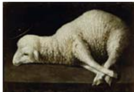
Francisco de Zurbarán Agnus Dei 1635

Il castigo, concludono i ricercatori, non è una buona strategia per promuovere la cooperazione, ma corrisponde ad altre esigenze, come quella di rinforzare una gerarchia di comando o difendere una proprietà. E ammoniscono: in una società competitiva come quello di oggi, vince chi resiste alla tentazione di esasperare i conflitti, mentre chi sceglie di punire, perde, vittima della sua stessa arma.