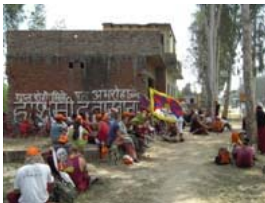
Sosta a 43 gradi

E' difficile poter parlare di empatia, ma abbiamo notato che il nostro intervento è stato apprezzato "almeno parliamo con persone intelligenti di argomenti interessanti" questa è stata la loro giustificazione. Inoltre, alla fine di ogni seduta, chiedevamo loro se erano interessati a continuare o se invece dovevamo iniziare con altre persone. La risposta è stata molto chiara ed esplicita "vogliamo continuare, quando ci vediamo?".