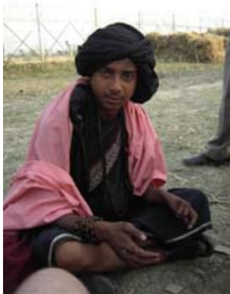
Un piccolo baba

Caporali, R., Forconi, D. I miti greci. Giunti. 2005 Programma per windows: Stellarium 0.8