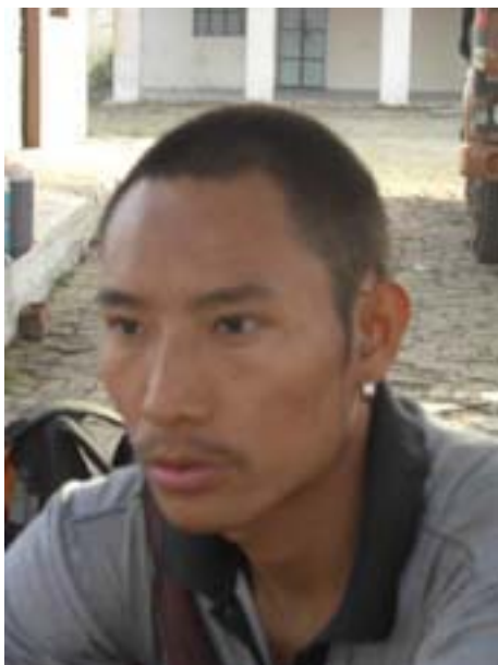
Lobsand dell'Indian Students for Free Tibet