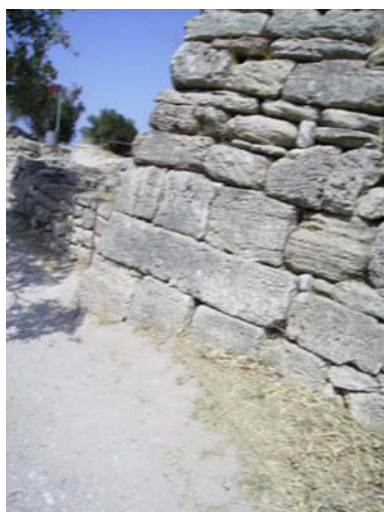
Le porti scée a Troia