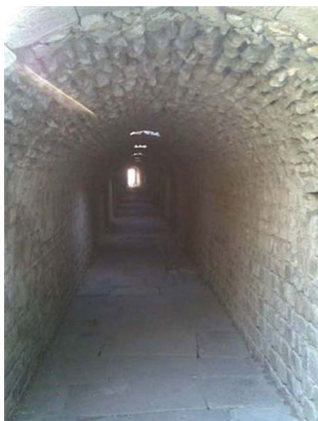
Percorso sotterraneo nel tempio di Esculapio

-offro spazio in condivisione in studio in zona Corso Genova Metropolitana Sant'ambrogio Info: annasilviapersico@tiscali.it , cell. 347.8207716