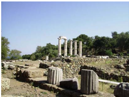
tempio dei Grandi dei di Samotracia