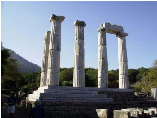
Altare dei Cabiri a Samotraccia