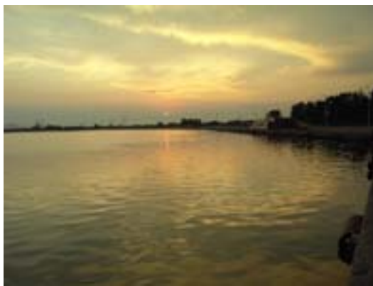
Laguna di Missolungi

(il testo integrale dell'articolo è disponibile in www.psicoterapia.it/cstg Forum - Area Allievi- Articoli )