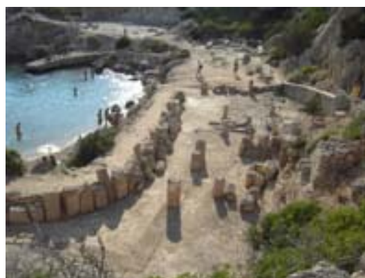
Heraion di Peragora

Dal punto di vista più intimo, ho avuto una grossa emozione alla sua morte, non dolore, ma grande emozione ed affetto per lui. Avevamo da tempo chiuso qualsiasi storia di risentimento e rivalsa proveniente dal passato. Molte delle Gestalt erano state chiuse specialmente con il percorso sulle figure genitoriali che avevo fatto quando frequentai il Corso di Counseling negli anni novanta e nel mio percorso di terapia.