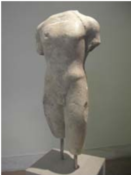
Busto. Museo di Itaca