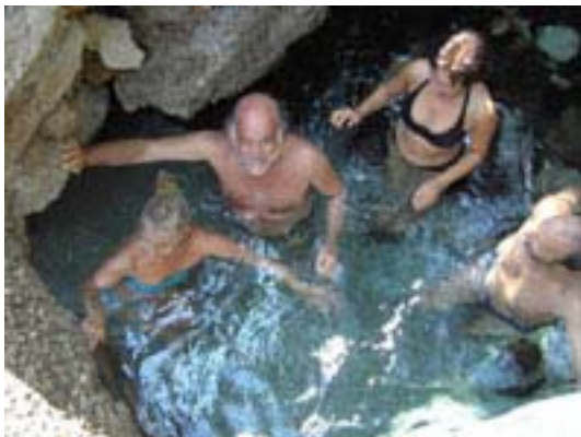
Bagni di Elena

nell'apprendimento e nello sviluppo linguistico complessivo. Un altro studio dell'Università di Chicago sfata lo stereotipo secondo cui a parlare con le mani siano soprattutto persone di estrazione sociale modesta. I ricercatori hanno monitorato 50 famiglie con bambini che avevano da poco compiuto un anno; i piccoli di ceto sociale elevato hanno dimostrato un'attività di gesticolazione più intensa e vivace degli altri e hanno espresso in un'ora e mezzo 24 significati gestuali contro i 13 espressi da bambini di famiglie più svantaggiate. Gesticolare non serve solo a esprimersi meglio, ma anche a imparare, a fare più spazio nella memoria e ad acquisire nuove nozioni e capacità, come dimostra una ricerca della psicologa Susan Wagner Cook pubblicata su «Science»: sono stati analizzati due gruppi di bambini delle elementari che dovevano cimentarsi con degli impegnativi esercizi di matematica. I bambini del primo gruppo sono stati invitati a gesticolare liberamente, agli altri è stato chiesto espressamente di tenere ferme le mani. I primi hanno risolto i loro problemi molto più brillantemente dei secondi. LAURA LAURENZI