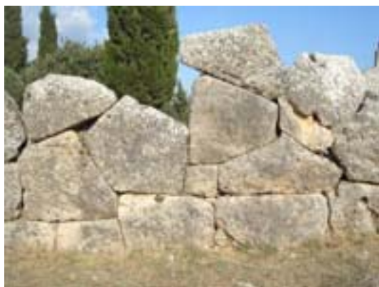
Il muro antipersiano a Corinto

La spada di ferro ha già compiuto la dovuta opera di vendetta; Gli aspri dardi e la lancia hanno già prodigato il sangue del perverso. A dispetto di un dio e dei suoi mari Ulisse è tornato al suo regno e alla sua regina, a dispetto di un dio e dei grigi venti e dello strepito di Ares. Già nell'amore del letto condiviso dorme la chiara regina sul petto del suo re: ma, dov'è quell'uomo che nei giorni e notti dell'esilio errava per il mondo come un cane e diceva che Nessuno era il suo nome?