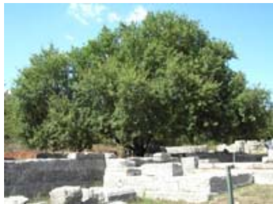
Quercia di Dodona