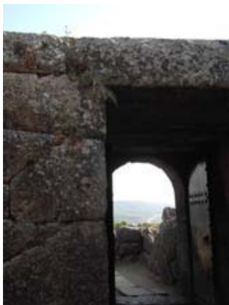
Ingresso del Necromanteion