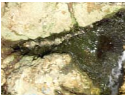
Sorgente dei Bagni di Elena

l'abbinamento si è fatto da sé. Restando in tema mi sembra opportuno riportare uno spunto tratto dal libro di Naranjo dedicato agli enneatipi. Qui Paco Penarrubia scrive che per il tipo 7, ossia quello caratterizzato dalla gola e dall'edonismo, a cui lui testimonia di appartenere e in cui anch'io mi riconosco, Gurdjieff prescrive una precisa terapia: la sofferenza conscia, cioè l'accettazione volontaria della sofferenza, da considerare come una parte necessaria del lavoro da svolgere ai fini della propria evoluzione.