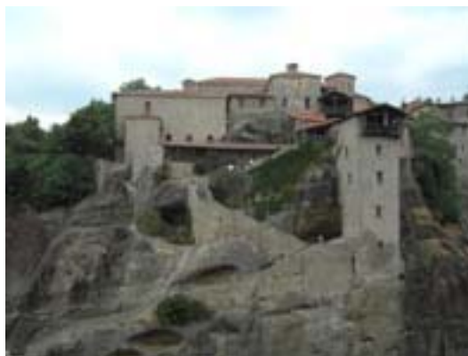
Monastero della Grande meteora