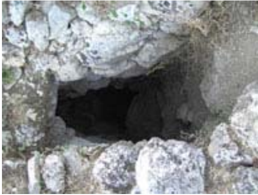
Antro delle Ninfe