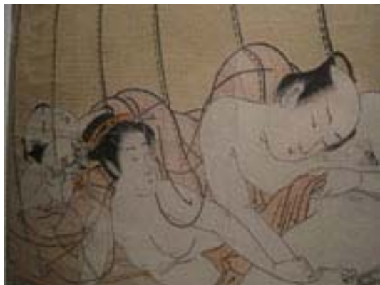
scena primaria ...