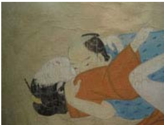
Scuola di Sunsho