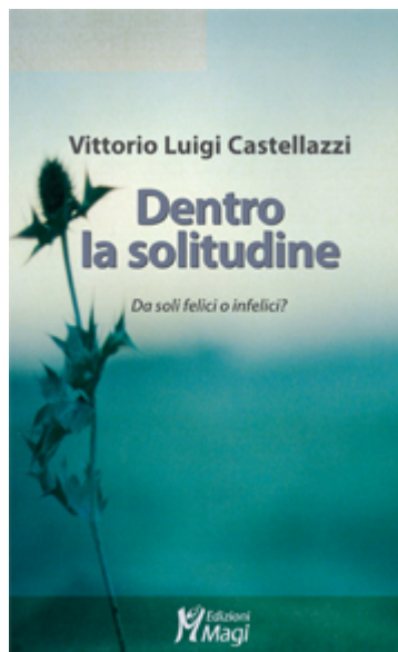
Vittorio Luigi Castellazzi Dentro la solitudine Da soli felici o infelici?

COLLANA: Lecturae PREZZO: 12,00 PAGINE: 144