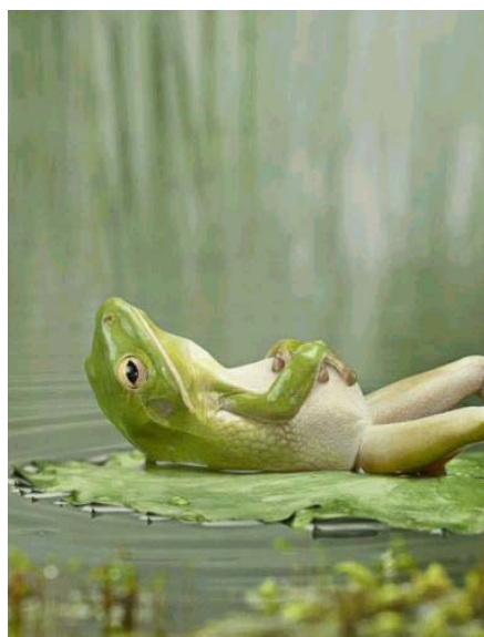
Cogito ... ergo sum?